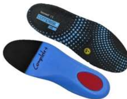
95162083127XXX Secosol Complete +