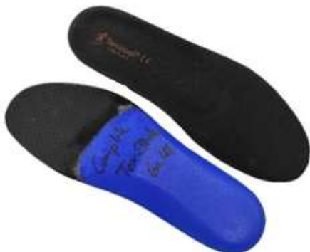
95162201451XX Secosol Complete Kit, EVA Cover