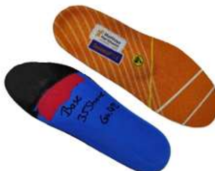
9516101XXX7XXX Kit Secosol 9516, A B, C, textil Cover