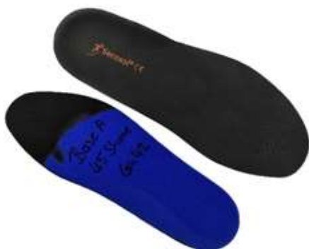
9516101XXX5XXX Kit Secosol 9516, A B, C, EVA Cover