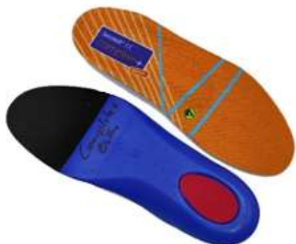
OSM95162083127XXX Secosol Complete + Ortho