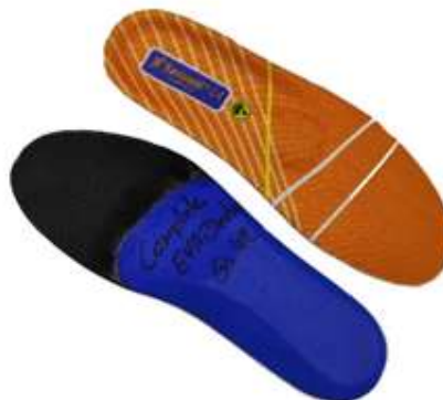
95162201471XX Secosol Complete Kit, textil Cover